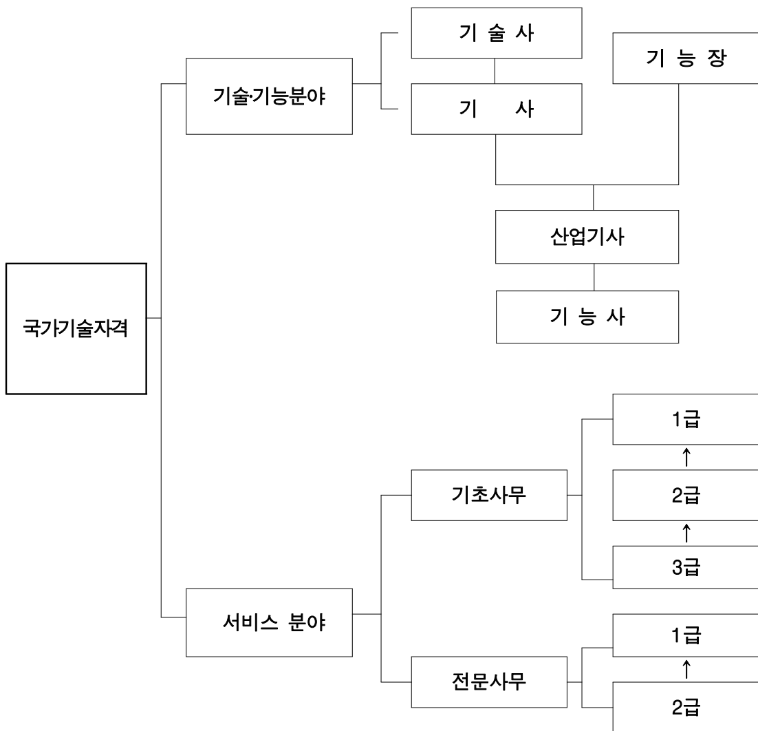
[그림2] 국가기술자격제도 체계