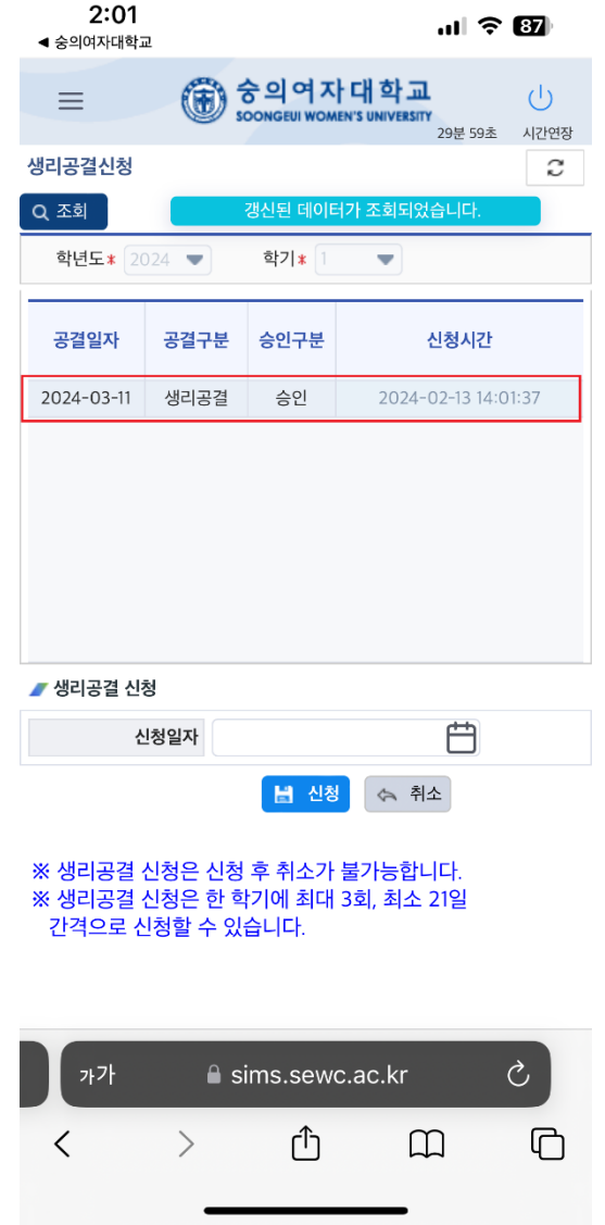
④ 메뉴 상단에 공결일, 공결구분, 승인구분, 신청시간 표시됨