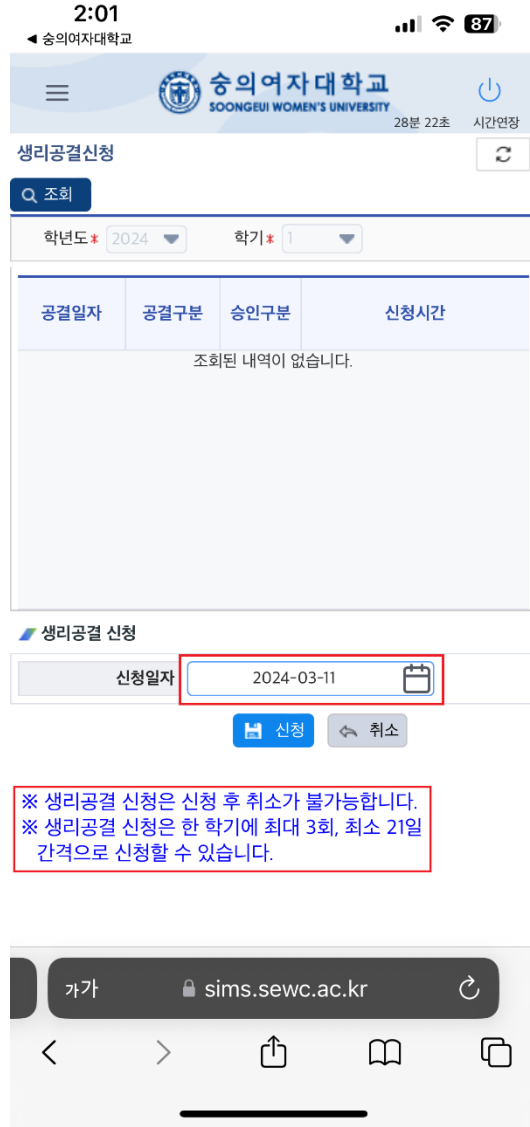
② 한 학기 최대 3회 가능 신청간격 21일 이상